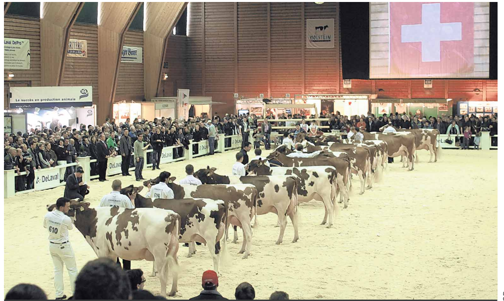
Les meilleures Holstein et Red Holstein du pays se retrouveront ce week-end à Bulle.

Une exposition d'une telle envergure permet de faire le point sur la génétique la plus utilisée dans notre pays. Cette édition, plusieurs taureaux seront fortement représentés. Pour la Holstein, contrairement à ces dernières années, un taureau surpasse largement les autres au niveau de sa représentation au catalogue. Il s'agit de Goldwyn avec 30 filles inscrites au catalogue.