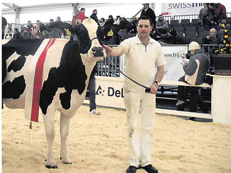
M. GOGNIAT, LE QUOTIDIEN JURASSIEN

16 et 18 Après Arc Jurassien Expo samedi dernier à Saignelégier, c'est ce week-end au tour de la prestigieuse EXPO Bulle. Pour cette 40 e édition, la crème de l'élevage helvétique y sera représentée avec 285 Holstein et 265 Red Holstein inscrites au catalogue. Le National Red Holstein se déroulera demain samedi, suivi dimanche par le National Holstein.