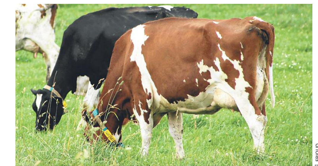
Le trèfle blanc est naturellement présent dans les prairies pâturées.

La variété Pastor est issue d'un écotype du Jura croisé avec du matériel de sélection. Elle se caractérise par sa petite taille et présente des feuilles plus petites que le trèfle violet habituel. La variété a été testée en pâture dans différentes situations, notamment en association avec la fétuque élevée. Les résultats positifs ont conduit à son inscription au catalogue français des variétés. Pastor a montré une très bonne capacité de ré-